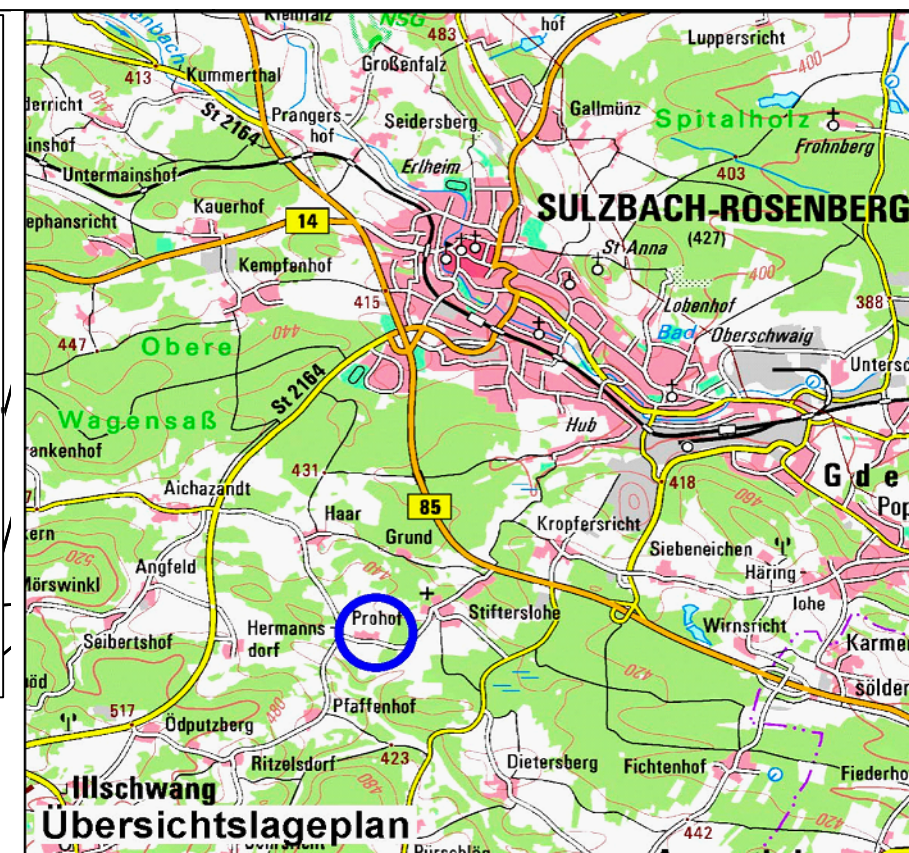
Stadt Sulzbach-Rosenberg Stadtteil Prohof