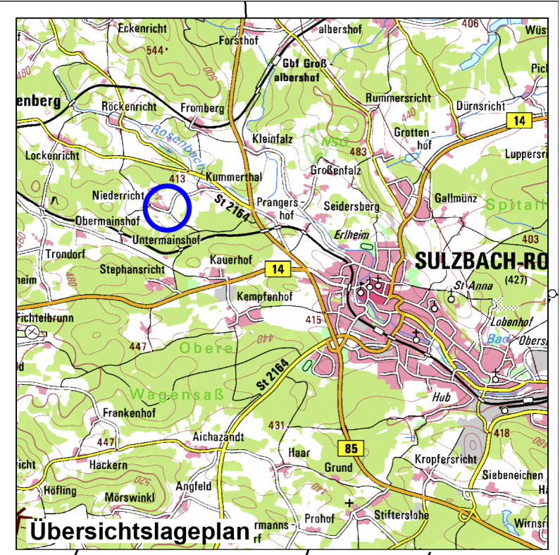
Stadt Sulzbach-Rosenberg Stadtteil Niederricht